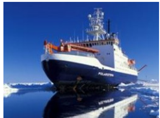
LOHAFEX / Polarstern.

Enero: El proyecto de investigación indo-alemán LOHAFEX lleva anclas con el plan de verter seis toneladas de hierro en el Océano del Sur. Nuevamente se forma una amplia coalición opositora al proyecto, en la que participan organizaciones de Sudáfrica, Alemania, India y Sudamérica, así como organizaciones civiles internacionales como el African Center for Biosafety, WWF, Greenpeace, ETC, IUCN, Bund, el Foro Alemán de ONGs, la Red del Tercer Mundo, el Colectivo Internacional en Apoyo de los Pescadores, entre otras. Los opositores al proyecto afirman que este plan viola la moratoria decretada por el Convenio sobre Diversidad Biológica, de la cual India y Alemania son partes. En consecuencia, el Ministerio Alemán de Medio Ambiente pide que el experimento sea suspendido , aunque éste continúa ya que es financiado y opera bajo el auspicio del Ministerio de Ciencia de Alemania.