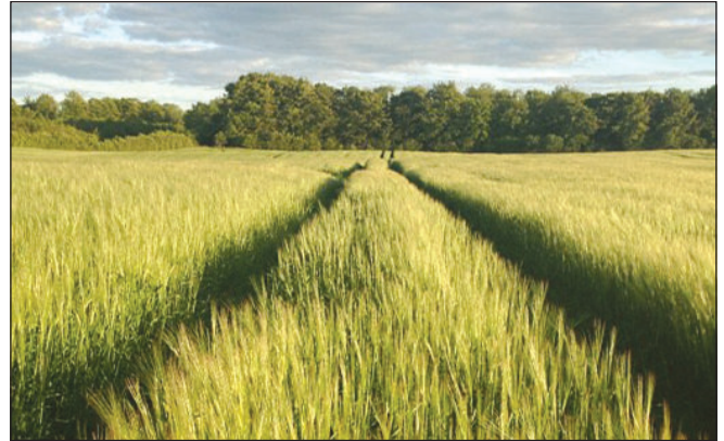
Se podría manipular genéticamente cebada y otros cultivos para ser más reflejantes.

Un estudio de modelización realizado por investigadores del Instituto Alemán de Potsdam para el Cambio Climático (PIK) sugirió intentar retrasar el aumento del nivel del mar disparando cantidades muy grandes de nieve artificial sobre dos glaciares en la Antártida occidental. El PIK ha calculado que para ello se necesitarían más de 12 mil aerogeneradores para elevar, desalinizar y pulverizar esta gran cantidad de agua. Todo el proyecto supondría una devastación ecológica a escala masiva, con enormes alteraciones del sensible hábitat marino antártico. 3